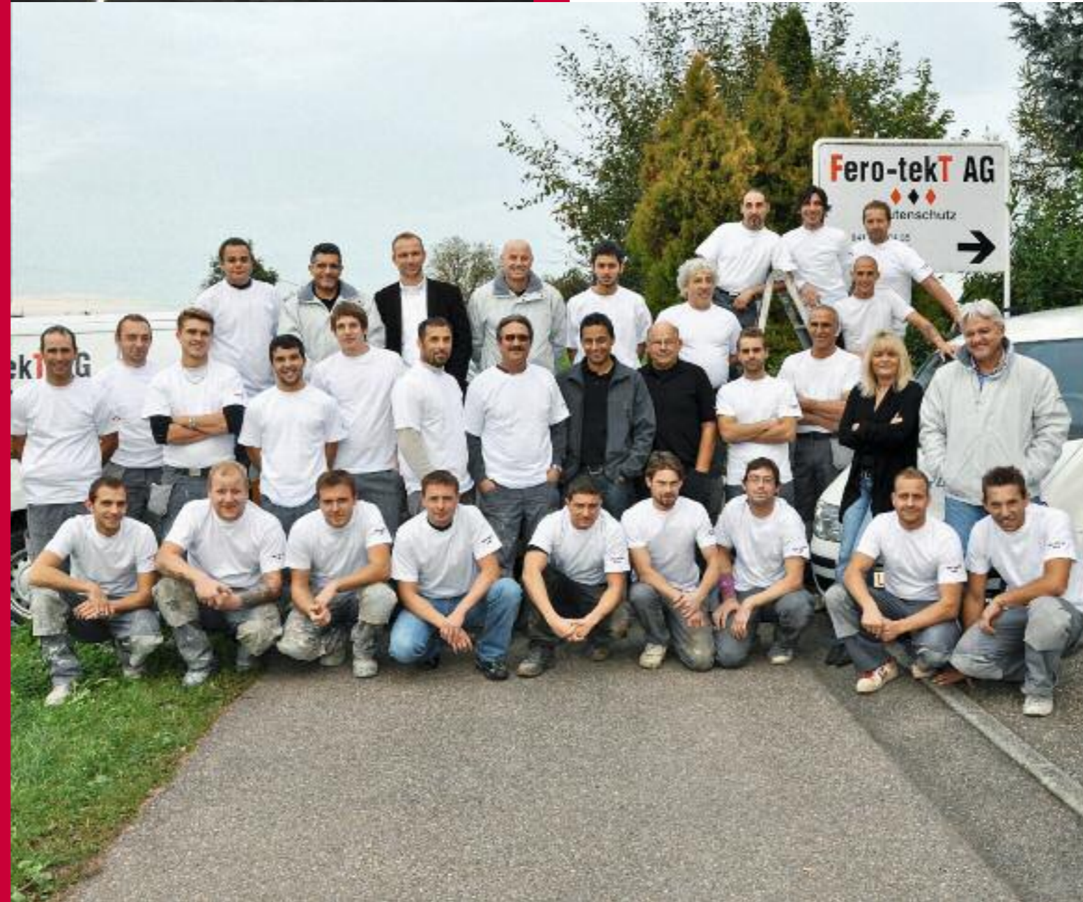
Abdichtungen / Injektionen

Birmensdorferstrasse 24 8902 Urdorf Telefon +41 43 928 34 35 Fax +41 43 928 34 36 E-Mail info@fero-tekt.ch www.fero-tekt.ch